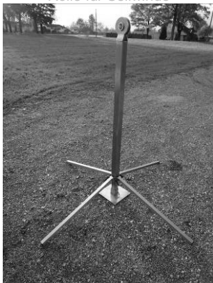
Stand-Up im aufgestellten Zustand