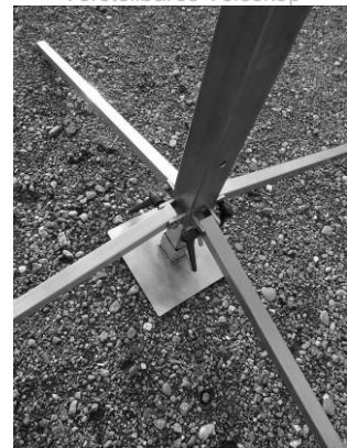
Stand-Up mit optimalen Stützen

Technische Änderungen und eventuelle Preisanpassungen bleiben vorbehalten. Lieferkosten und allfällige Zoll- und Mehrwertsteuer werden zusätzlich verrechnet. Angebote gültig bis Ende August 2011